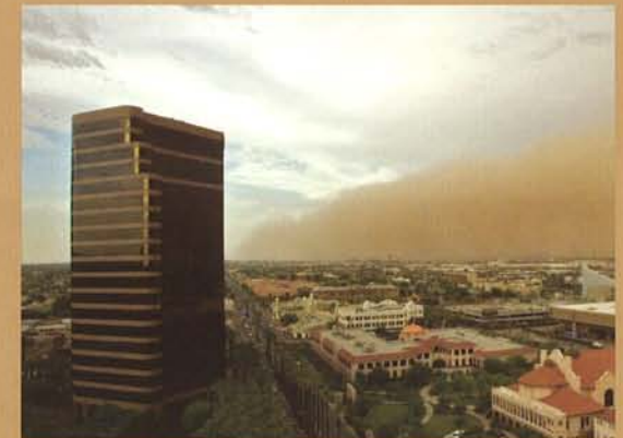
Photo courtesy of Rob Schumacher, The Arizona Republic, June 7, 2006